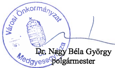
Dr. Nagy Béla György polgármester