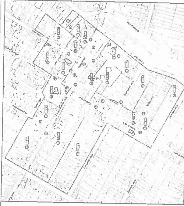
Beváros (12. melléklet)