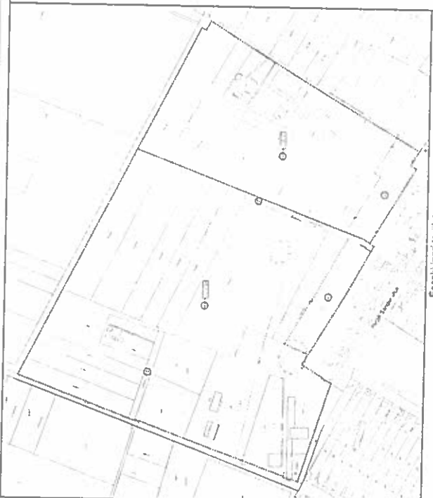
Eszaki part terület (13. melléklet)