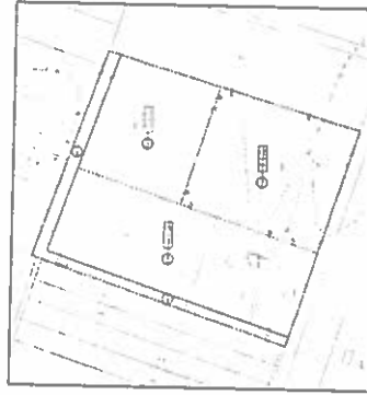
Nyugati part terület (11. melléklet)